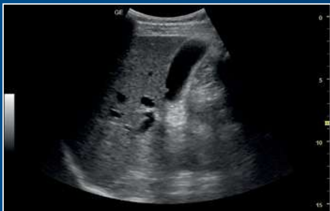
CrossXBeam™ e SRI-HD definiscono chiaramente i bordi delle strutture.