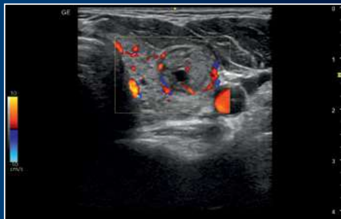
Color Doppler per esaminare la vascolarizzazione tiroidea e il flusso sanguigno nei vasi.